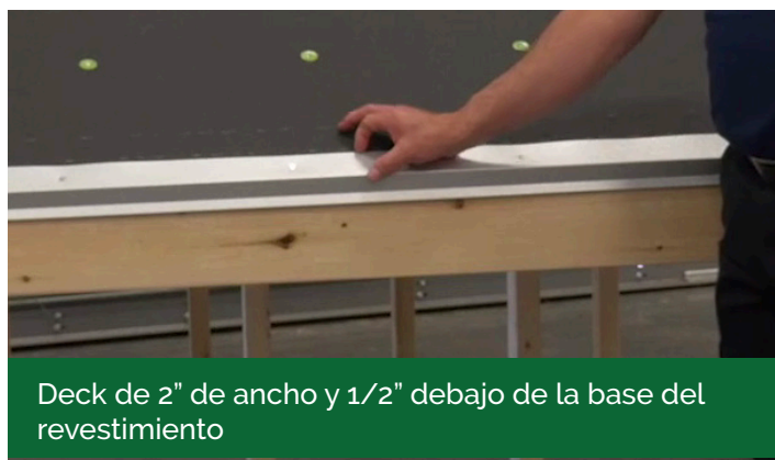
Deck de 2" de ancho y 1/2" debajo de la base del revestimiento

Escriba el domicilio en el deck del techo.