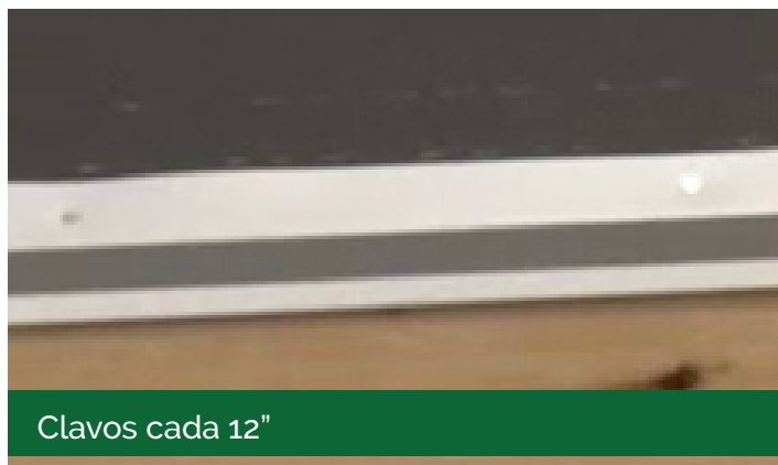
Clavos cada 12"